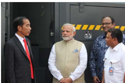
Water Cannon Pindad Menarik Minat PM India (31 Mei 2018)