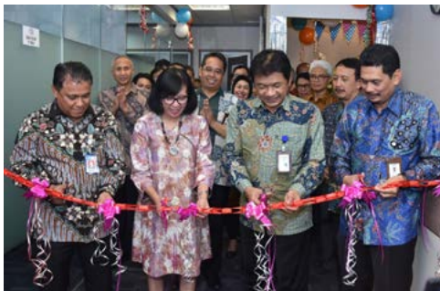
Peresmian Kantor Cabang Bersama (21 September 2018)