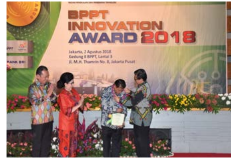
Penghargaan BPPT Innovation Award 2018

PT. Pindad (Persero) mendapatkan penghargaan atas inovasi di bidang Pertahanan dan Keamanan yang diselenggarakan oleh Badan Pengkajian dan Penerapan Teknologi (BPPT) (2/8/2018).