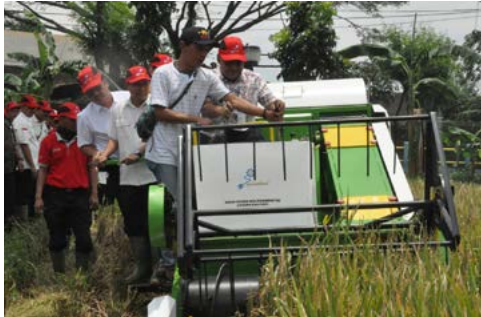
Pindad Perkenalkan Alsintan Harvester (1 Maret 2018)