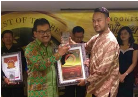
The Most Trusted Company of the year Best In Business Indonesia

PT. Pindad (Persero) mendapatkan penghargaan atas inovasi di bidang Pertahanan dan Keamanan yang diselenggarakan oleh Badan Pengkajian dan Penerapan Teknologi (BPPT) (2/8/2018).