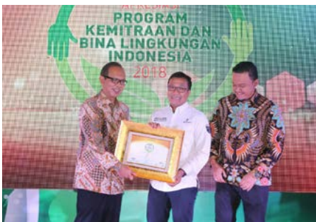
Penghargaan Apresiasi PKBL Indonesia 2018

PT Pindad (Persero) meraih penghargaan dalam ajang Infobank 9th BUMN Award 2018 kategori BUMN Industri Pertahanan dengan predikat BUMN "Sangat Bagus" atas kinerja keuangan selama Tahun 2017. Penghargaan ini diselenggarakan oleh Infobank sebagai perusahaan pembuatan rating untuk menilai kinerja perusahaan BUMN. (26/09/2018)