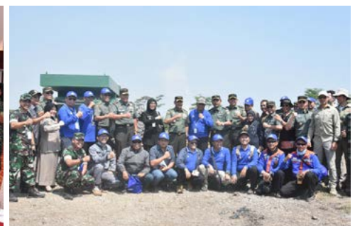
Uji Ledak Ranjau Medium Tank (17 Juli 2018)