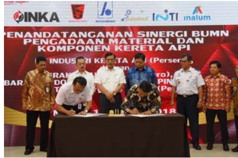
Sinerigi Pindad-INKA (19 Januari 2018)