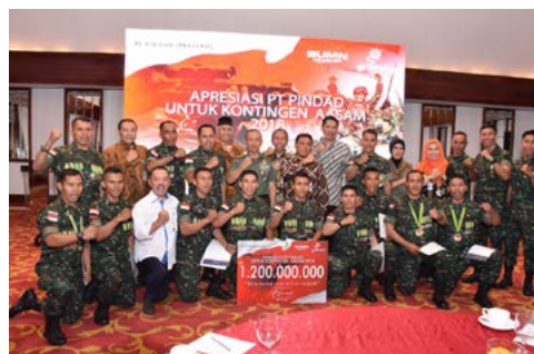
Keandalan Senjata dan Munisi Pindad Pada AASAM 2018 (4 Juni 2018)