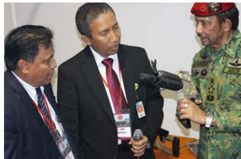
Dukungan Presiden RI dan Sultan Brunei Darussalam (3 Mei 2018)