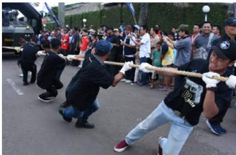
Tarik Panser HUT Pindad Ke-35 (30 April 2018)