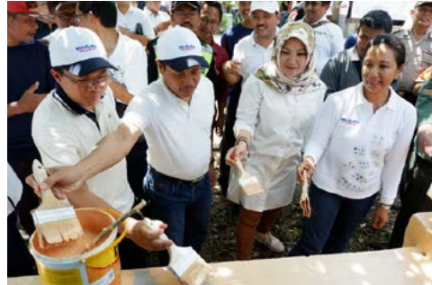
Sinerigi BUMN, Padat Karya Tunai di Klaten (24 Maret 2018)