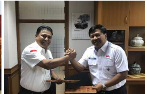
Sinerigi Pindad-BKI (5 Februari 2018)