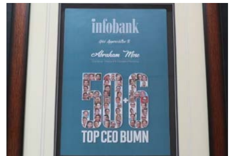
Penghargaan BPPT Innovation Award 2018