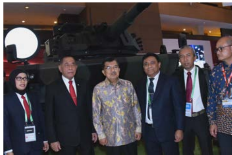
Apresiasi Wapres dan Menteri Pertahanan Terhadap Produk Pindad di Indodefence (7 November 2018)