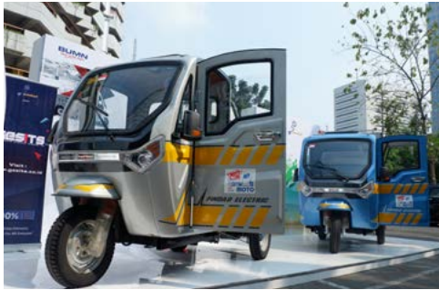
Kendaraan Bermotor Listrik (31 Juli 2018)