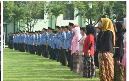
Upacara peringatan Hari Bela Negara (HBN) 2018 di PT Pindad, Turen, Malang pada 21 Desember 2018.