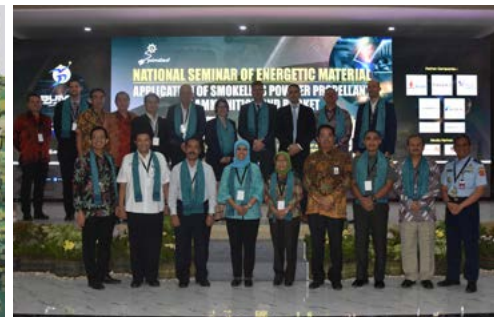
National Seminar of Energetic Material Didukung Mitra Internasional (8-9 Mei 2018)