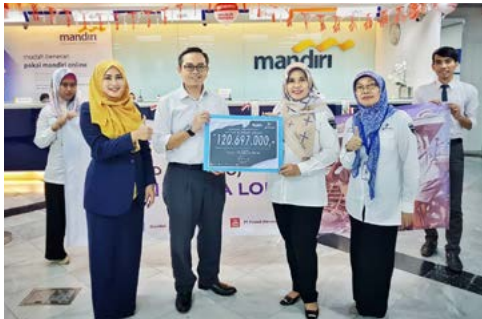
Donasi Karyawan Pindad Gempa Lombok (21 Agustus 2018)