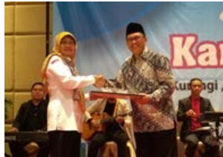
Apresiasi Peduli Lingkungan Hidup Pemkot Bandung (13 Desember 2018)