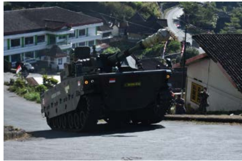
Uji Daya Gerak Medium Tank (14 Agustus 2018)