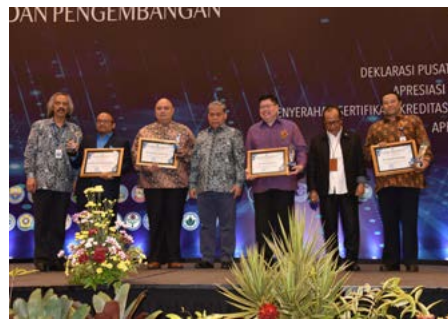
Apresiasi Lembaga Penelitian dan Pengembangan Riset DIKTI (13 Desember 2018)

PT Pindad (Persero) meraih tiga kategori penghargaan pada ajang bergengsi BUMN Branding & Marketing Award 2018 yang diselenggarakan pada Rabu, 21 November 2018 di Hotel JS Luwansa, Jakarta. PT Pindad meraih juara pada kategori The Best Marketing, The Best Brand Identity dan The Best Chief Marketing Officer Sector Agro, Manufacturing & Mining.