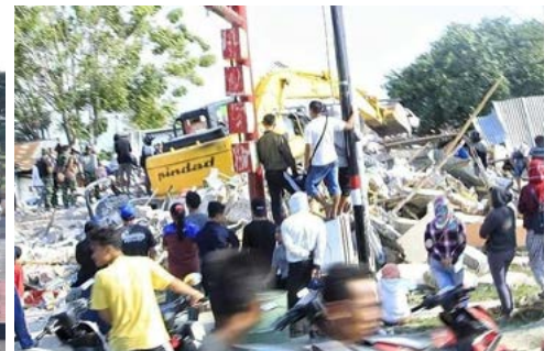
Bantuan Excava 200 Pasca Gempa Palu (9 Oktober 2018)