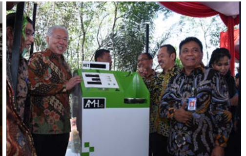
Launching AMH-o Oleh Menteri Perdagangan (15 September 2018)