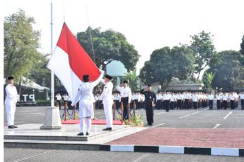
Pindad Peringati 73 Tahun Indonesia Merdeka di Bandung dan Malang (17 Agustus 2018)