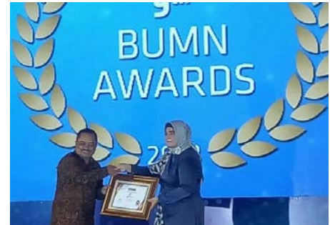
Penghargaan Infobank 9th BUMN Award 2018

PT Pindad (Persero) meraih penghargaan dalam ajang Infobank 9th BUMN Award 2018 kategori BUMN Industri Pertahanan dengan predikat BUMN "Sangat Bagus" atas kinerja keuangan selama Tahun 2017. Penghargaan ini diselenggarakan oleh Infobank sebagai perusahaan pembuatan rating untuk menilai kinerja perusahaan BUMN. (26/09/2018)