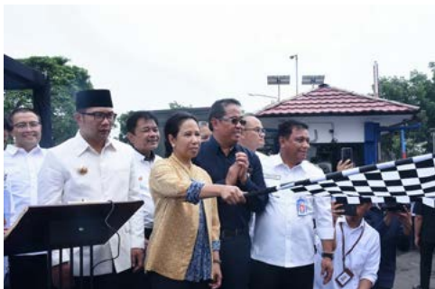
Ekspor Produk Pindad (31 Oktober 2018)