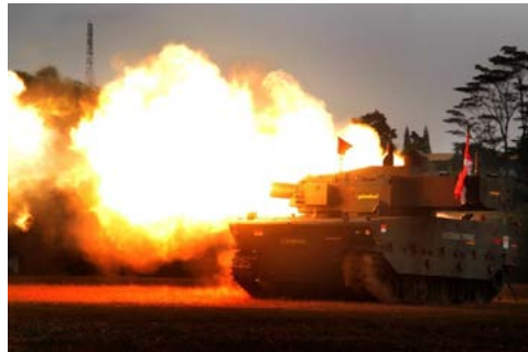
Uji Tembak Medium Tank (28 Agustus 2018)