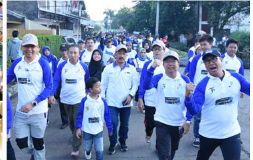
Jalan Santai HUT Pindad Ke-35 (30 April 2018)