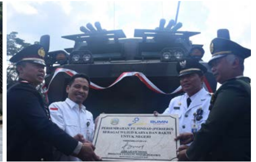
Monumen Panser Anoa Menjadi Ikon Kota Malang (20 Agustus 2018)