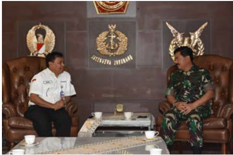
Tingkatkan Kinerja, Pindad dan Panglima TNI (5 Januari 2018)