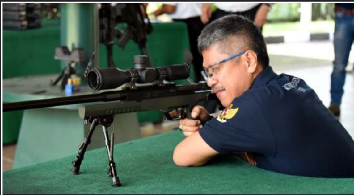
Mabes Polri mencoba secara langsung performa berbagai senjata buatan Pindad yang terdiri dari Pistol G2 Elite, Ss2 V4 dan SPR 3 di lapangan tembak Divisi Senjata (5/9/2016)