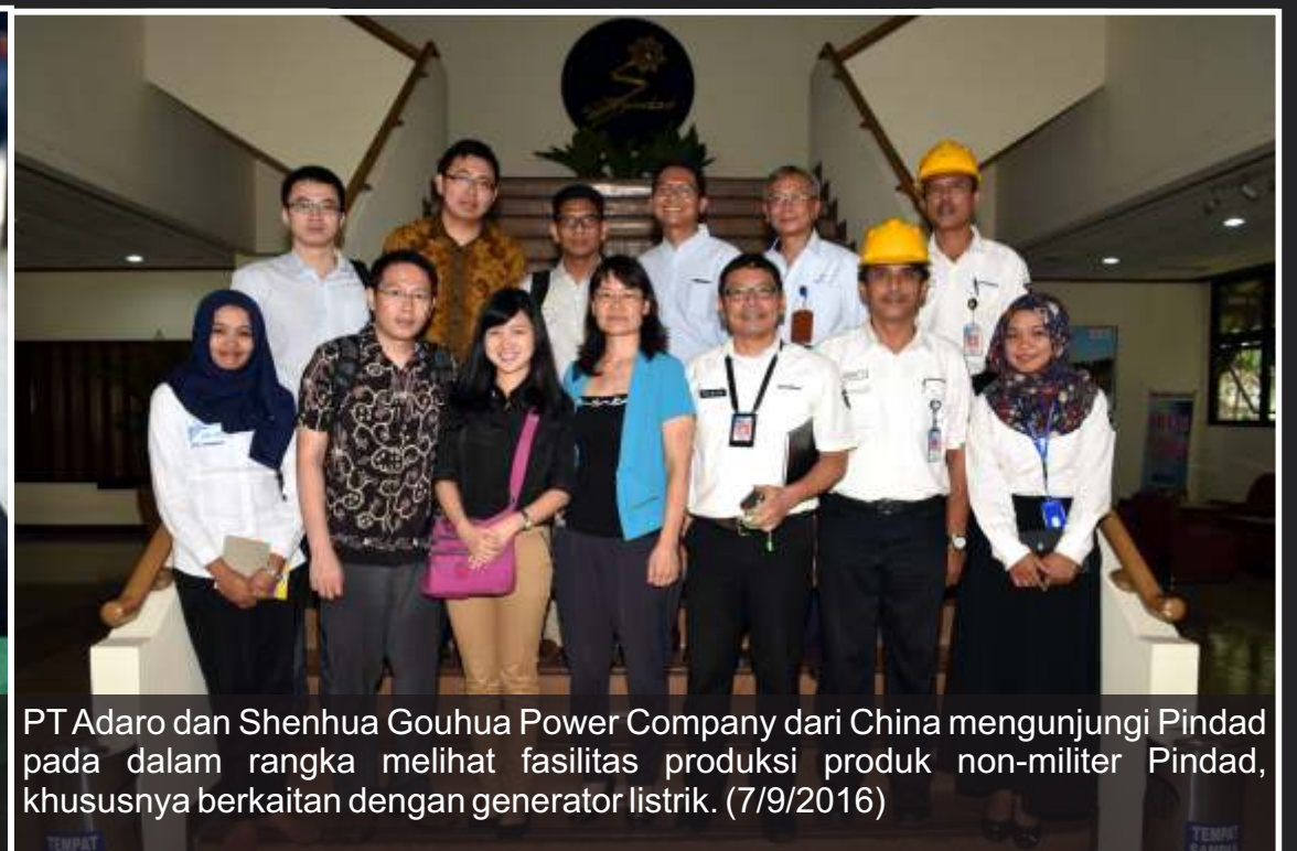
PT Adaro dan Shenhua Gouhua Power Company dari China mengunjungi Pindad pada dalam rangka melihat fasilitas produksi produk non-militer Pindad, khususnya berkaitan dengan generator listrik. (7/9/2016)