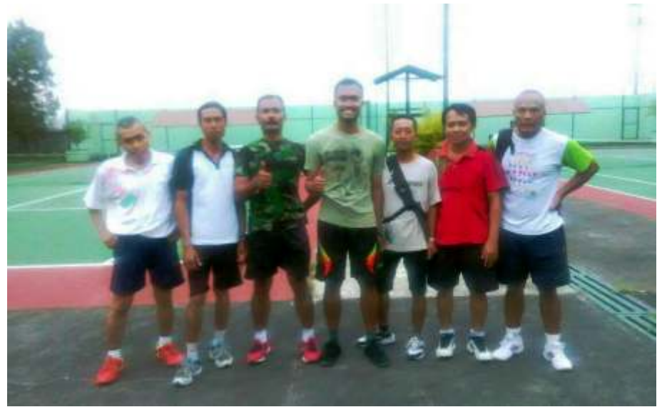
Dokumentasi Komunitas Tenis Pindad Turen

D ivisi Munisi PT Pindad (Persero), Turen memiliki beberapa komunitas olahraga untuk para karyawannya. Salah satunya adalah komunitas tenis, yang sudah lama berdiri dan cukup aktif dalam melakukan latihan dan mengikuti pertandingan, resmi maupun persahabatan.