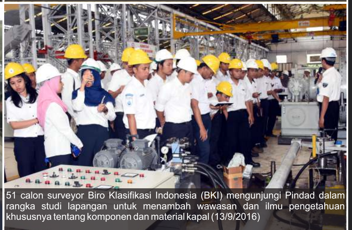
51 calon surveyor Biro Klasifikasi Indonesia (BKI) mengunjungi Pindad dalam rangka studi lapangan untuk menambah wawasan dan ilmu pengetahuan khususnya tentang komponen dan material kapal (13/9/2016)