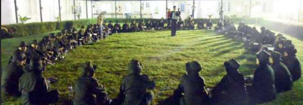
Peserta Susnalind 2016 mengikuti caraka malam untuk melatih kerjasama anggota tim, keberanian, mental, serta kewaspadaan para siswa.

Lima puluh tujuh calon pegawai baru PT Pindad (Persero) mengikuti rangkaian Acara Kursus Pengenalan Industri (Susnalind) 2016. Acara ini diselenggarakan selama 1 minggu, dibuka pada 29 Agustus 2016 oleh Deputy Direktur Human Capital dan General Affair (HCGA) Achyarmansyah Lubis. Dalam sambutannya, beliau memberikan motivasi kepada para siswa Susnalind 2016 untuk jadi pekerja yang unggul. "Pindad membutuhkan pegawai yang fokus karena industri ini membutuhkan perhatian lebih dan ketelitian. Jangan jadi pekerja biasa, be the champion! " ujarnya.