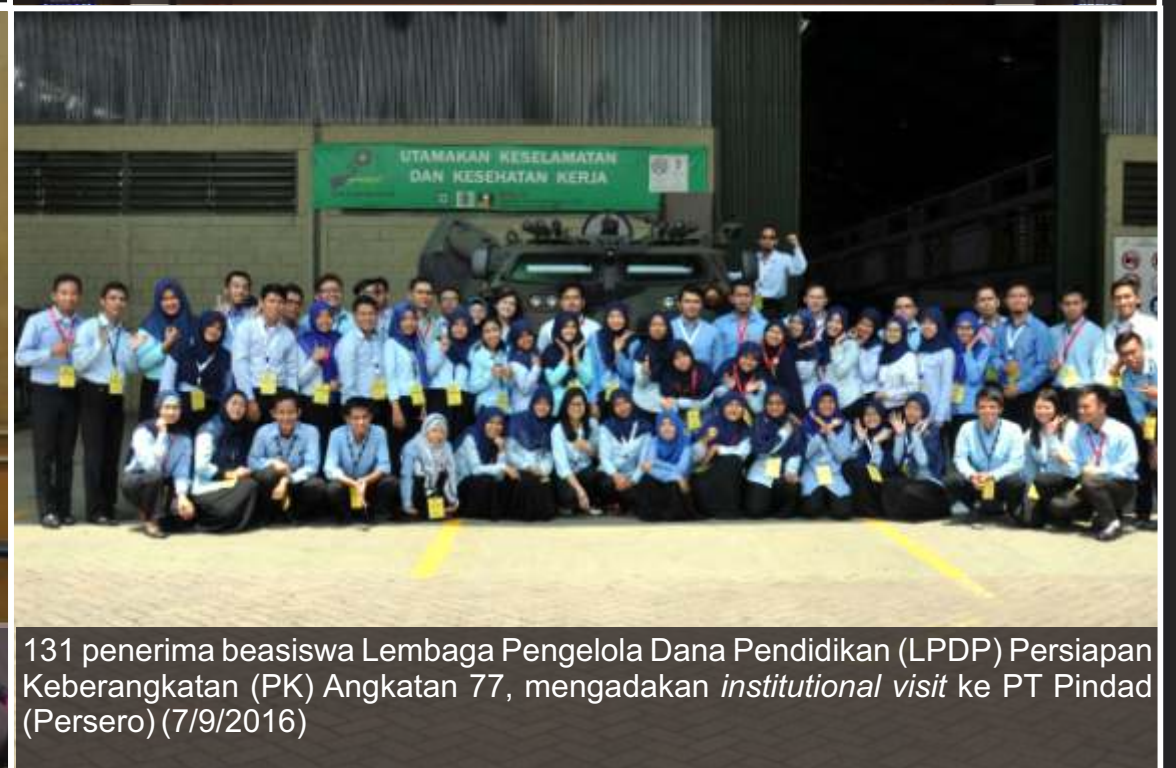
131 penerima beasiswa Lembaga Pengelola Dana Pendidikan (LPDP) Persiapan Keberangkatan (PK) Angkatan 77, mengadakan institutional visit ke PT Pindad (Persero) (7/9/2016)