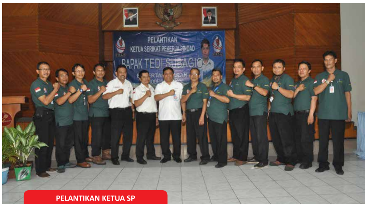
PELANTIKAN KETUA SP

Organisasi nirlaba Medco Foundation mengunjungi PT Pindad (Persero) (10/10). Kunjungan tersebut untuk mengenal berbagai produk dan teknologi karya anak bangsa.