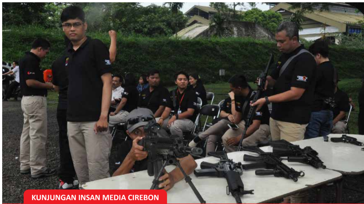
KUNJUNGAN INSAN MEDIA CIREBON

PT Pindad (Persero) menggelar upacara bendera dalam rangka memperingati hari pahlawan di lapangan Kantor Pusat Pindad Bandung (10/11).