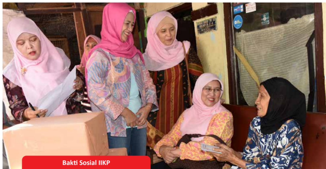
Bakti Sosial IIKP

PT Pindad (Persero) menyelenggarakan upacara bendera memperingati Hari Lahir Pancasila di pelataran lapangan Pindad Bandung. Bertindak sebagai inspektur Upacara adalah Direktur Utama, dan dihadiri oleh jajaran direksi, pejabat teras, dan para karyawan pindad (1/6)