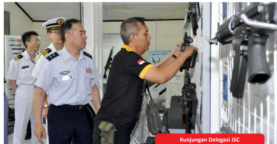
Kunjungan Delegasi JSC

Ikatan Istri Karyawan Pindad (IIKP) Cakra Pawestri & yayasan Cakra Binangkit melakukan anjang asih ke warakawuri di sekitar Pindad (12/6).