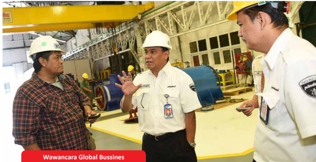
Wawancara Global Bussines

Ke depan, jajaran Pengurus berharap agar dapat kembali mengadakan kegiatan lain yang bermanfaat, tidak hanya bagi keluarga besar Cakrawana Pindad sendiri, namun secara lebih luas mampu memberikan manfaat dan kontribusi positif membantu tercapainya misi Perusahaan untuk menjadi produsen Alutsista terkemuka di Asia pada tahun 2023.